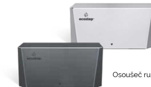
Osoušeč rukou R4.1