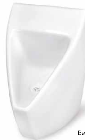
Bezvodý pisoár P1.1

Naše patentované ventily P1 jako jediné na trhu účinně zabraňují zápachu minimálně 6 měsíců. Konkurenční ventily se často mění po 1 až 5ti měsících, případně se musí zalévat velkým množstvím vody či speciální náplně.