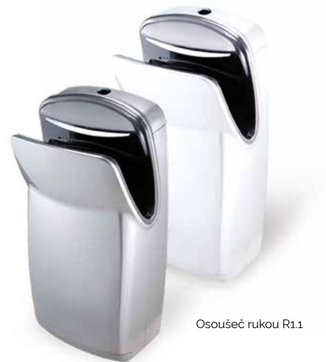
Osoušeč rukou R1.1