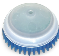
Bio Block Fresh

4) Після витирання всього бруду з пісуара знову нанесіть концентрат на внутрішні стінки і залиште діяти. Не витирати!